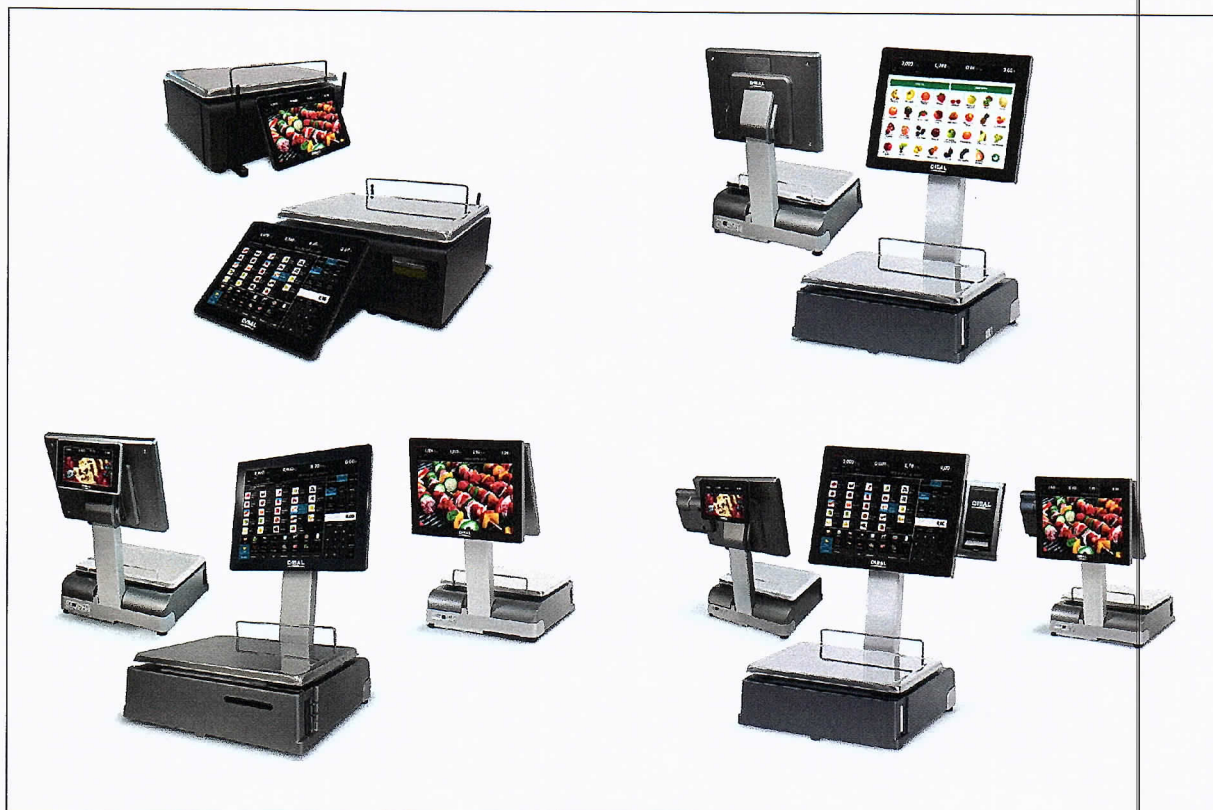
Слика 1. Пример изгледа ваге тип CS-1200